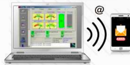
Software de Monitoreo