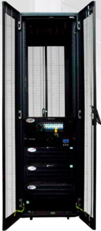
42RU Heavy Duty